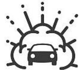
Взрывы в местах скопления людей, взрывы зданий и автотранспорта